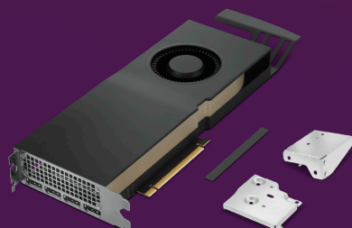
Tarjeta gráfica NVIDIA RTX™ A4500

Hasta 2 TB de almacenamiento SSD NVMe OPAL2 PCIe M.2 2280 de 4. a generación