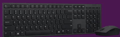
Combinación de teclado y ratón inalámbricos profesionales